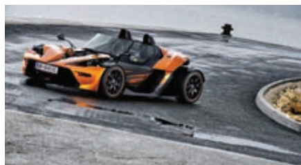
Фото 7. Панель с несущим слоем из углепластика для спортивного автомобиля X-Vow, изготовленная по технологии HP-RTM