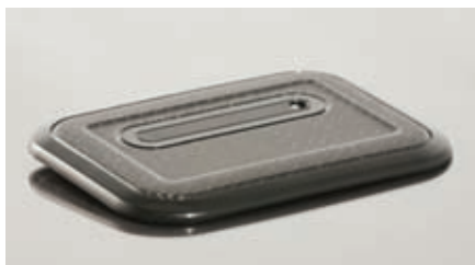
Фото 3. Элемент корпуса ноутбука из углепластика с толщиной стенки всего 0,6 мм, изготовленный с применением технологии органолистов

Первые результаты производства изделий из органолистов достигли уровня готовности к серийному использованию. В центре внимания дальнейшего развития находятся технические решения для термопластичных однонаправленных лент на основе стеклянных или углеродных волокон. Необходимый для этого практический опыт компания ENGEL накапливает при разработке собственного литьевого оборудования и средств автоматизации. В частности, некоторые ее роботы имеют углепластиковые руки, существенно более легкие по