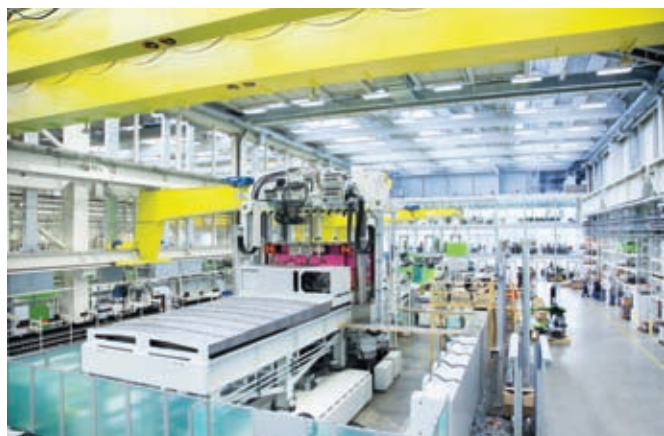
Фото 8. Завод больших литьевых машин ENGEL в г. Санкт-Валентине (Австрия): процесс сборки литьевой машины ENGEL v-duo 3600, предназначенной для поставки компании BMW