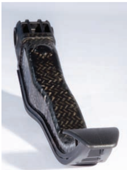
Фото 2. Композитная педаль тормоза, изготовленная в производственной ячейке на основе литьевой машины ENGEL insert 1050H/200

вариотермического термостатирования формы. Этот метод позволяет обеспечить минимальную толщину стенок и – несмотря на различную усадку компонентов – очень гладкие поверхности. Затем на эту деталь, которая должна иметь исполнение «под черный рояльный лак», в рамках одного цикла наносилось металлическое покрытие методом конденсации из газовой фазы (PVD) для электромагнитного экранирования компонентов ноутбука.