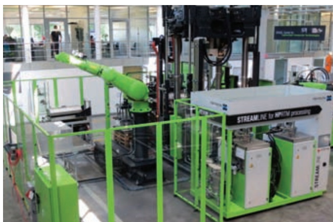
Фото 9. Производственная ячейка в технологическом центре, специально предназначенная для отработки технологии HP-RTM производства изделий из полимерных композитов

еще в 2012 г. – в год создания центра (см. фото у заголовка статьи). Тогда г-н Эггер заявил: «Сейчас еще нельзя с уверенностью сказать, какая именно технология станет наиболее распространенной для производства тех или иных деталей, однако мы уверены, что у всех этих технологий огромный потенциал». Но прошло 5 лет напряженной работы, и накопленный за эти годы опыт и потребность в ускоренном внедрении полученных результатов в практику вызвали необходимость создания нового подразделения – ENGEL Composite Systems, которое – в дополнение к существующему технологическому центру – будет сопровождать клиентов компании на пути организации и запуска на собственном предприятии серийного производства изделий из полимерных композитов. А технологический центр с этого момента сосредоточится еще больше на междисциплинарной разработке новых, особенно экономичных технологических решений.