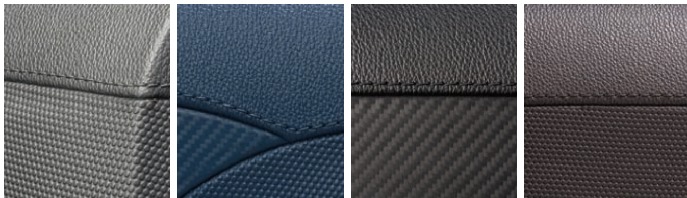
Фото 1. Материалы для технологии DecoJect были разработаны специально для применения во внутреннем пространстве транспортных средств. Они позволяют переносить на поверхность изделий различные структуры, а также цветовые и тактильные эффекты, включая текстуру кожи, швы и имитирующий углеродные материалы внешний вид

На выставке K-2016 компания ENGEL Austria GmbH (г. Швертберг, Австрия) вместе с несколькими своими партнерами провела первую презента-