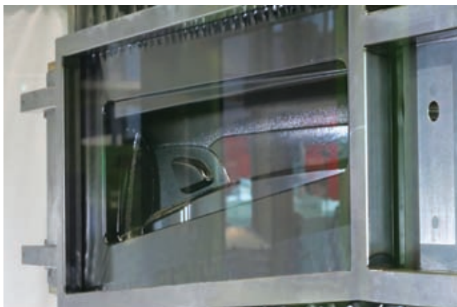
Фото 5. Во время нагрева начинается процесс штамповки пленки (на фото имеет черный цвет), которая при этом под воздействием создаваемого вакуума втягивается в форму для ее последующего структурирования

Затем на предварительно отформованную пленку по методу литья на подложку и с применением технологии MuCell наносится полипропилен специально разработанного для автомобильной промышленности вида (изготовитель – компания Vorealis AG, Вена, Австрия). Процесс литья с механическим вспениванием