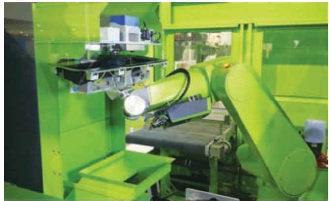
Фото 6. При изготовлении изделий по технологии DecoJect многоосевой робот и лазерная станция для обрезки пленки интегрируются в автоматизированную установку easiCell (слева). Робот перемещает край изделия вдоль лазера (справа), а затем укладывает готовое к использованию изделие на транспортирующую ленту