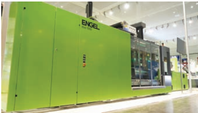
Фото 2. Литьевая машина ENGEL duo 5160/1000, на которой во время выставки К-2016 изготавливались имеющие большую площадь поверхности элементы внутренней облицовки двери легкого автомобиля